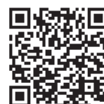
長岡京ガラシャ祭 HP

※ 2023-24年度、本コラムでは第2650地区内（福井・奈良・滋賀・京都）のさまざまな伝統ある「お祭り」をご紹介します。