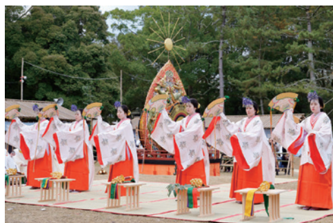
お旅所祭 社伝神楽奉納

続いて行われる「お旅所祭」でも、数多くの伝統芸能が8時間近く奉納されることから、おん祭は「日本芸能史のタイムカプセル」と称されています。