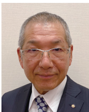
奈良第一グループ ガバナー補佐