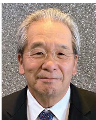
南部第2グループ ガバナー補佐