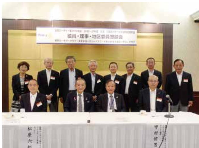
9月11日 やまとまほろばRC