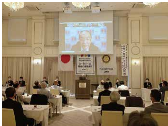
9月10日 福知山RC (WEB訪問)