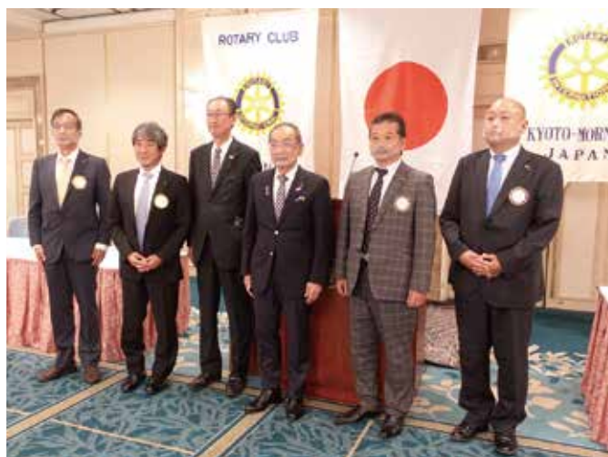
9月14日 京都モーニングRC