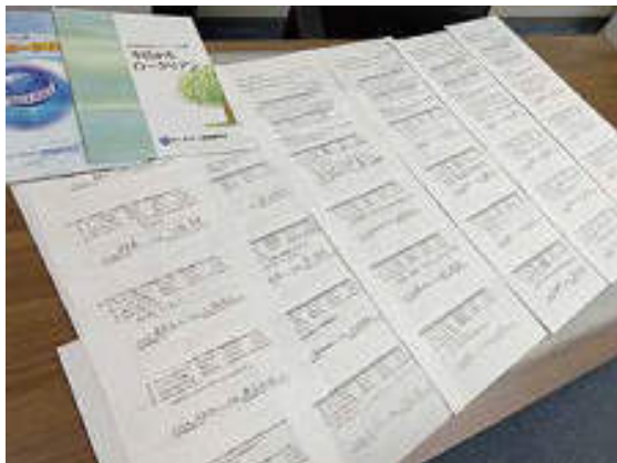
(回収したアンケート)

2021-22年度にフェイスtoフェイスで実施できることを期待して報告に代えます。