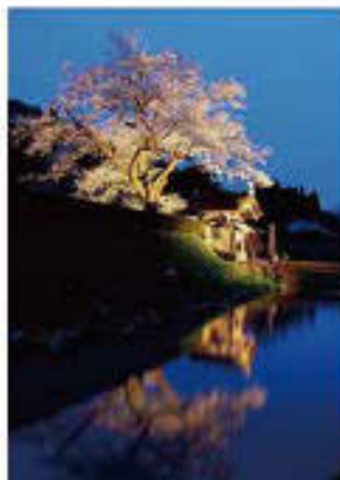
Vol. 10 (4月) 一乗谷城 朝倉義景館跡 唐門 (福井県)