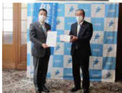
尾賀ガバナーノミニーから三日月知事へお手渡し