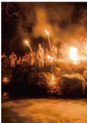
Vol. 9 (3月) お水送り (福井県)