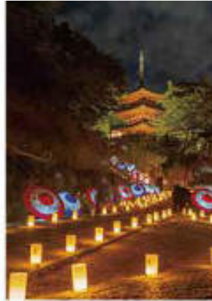
Vol. 3 (9月) 明日香 光の回廊 岡寺 (奈良県)