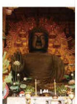
Vol. 8 (2月) 東大寺 大仏 (奈良県)