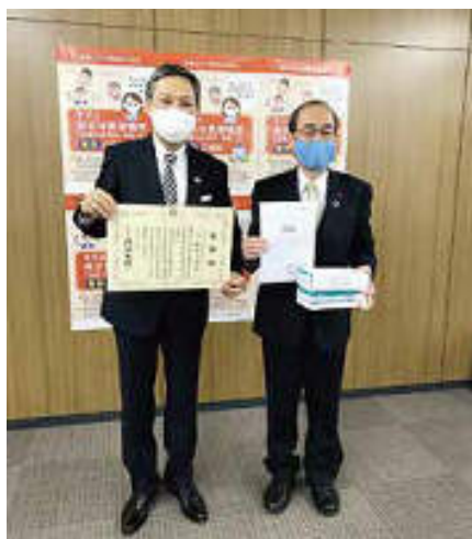
馬場ガバナーエレクトから門川市長へお手渡し