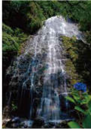
Vol. 2 (8月) 龍双ヶ滝 (福井県)