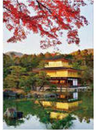
Vol. 4 (10月) 金閣寺 (京都府)