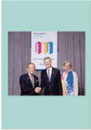
Vol. 1 (7月) クナーク氏と