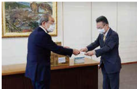
松原ガバナーから杉本知事へお手渡し