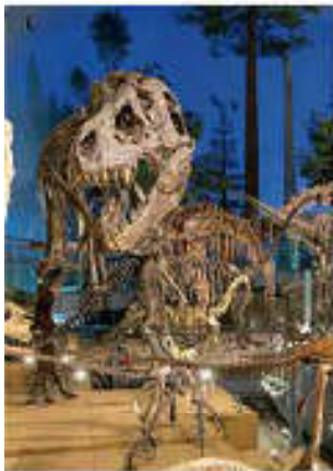
Vol. 5 (11月) 恐竜博物館 (福井県)