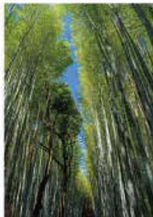
Vol. 11 (5月) 嵯峨野 (京都府)