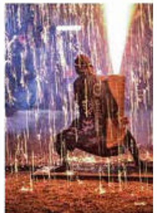
Vol. 12 (6月) 矢川神社 天筒火花 (滋賀県)