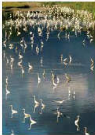
Vol. 6 (12月) 姉 川 (滋賀県)