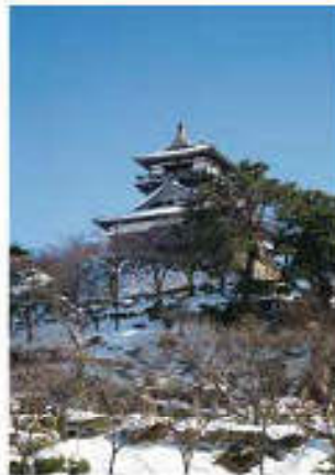
Vol. 7 (1月) 丸岡城 (福井県)