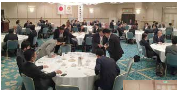
(2019-20年度 新会員セミナーの例)