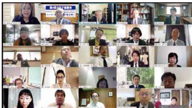
9月26日 日本ロータリークラブ2650