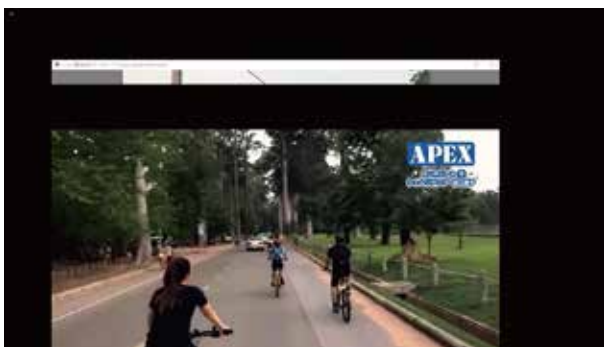
カンボジア シェムリアップの今の様子