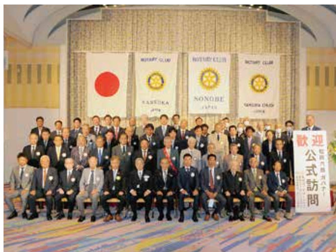
10月6日 亀岡RC・園部RC・亀岡中央RC