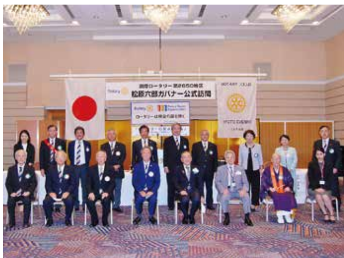
9月17日 京都イブニングRC