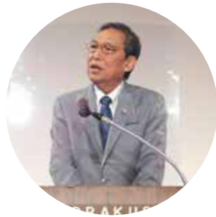
馬場益弘 ガバナーエレクト