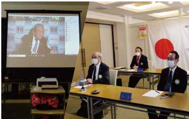
12月8日 京丹後RC (WEBにて)