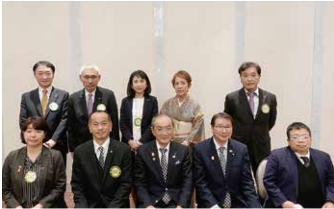
12月1日 福井フェニックスRC