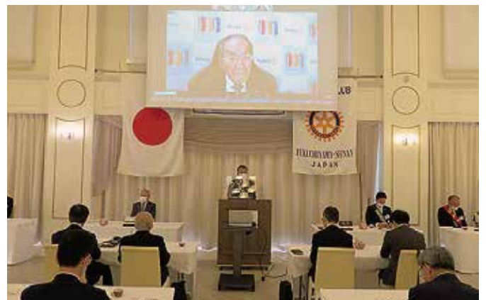
11月25日 福知山西南RC (WEBにて)