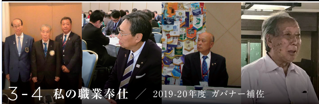
3-4 私の職業奉仕 / 2019-20年度 ガバナー補佐