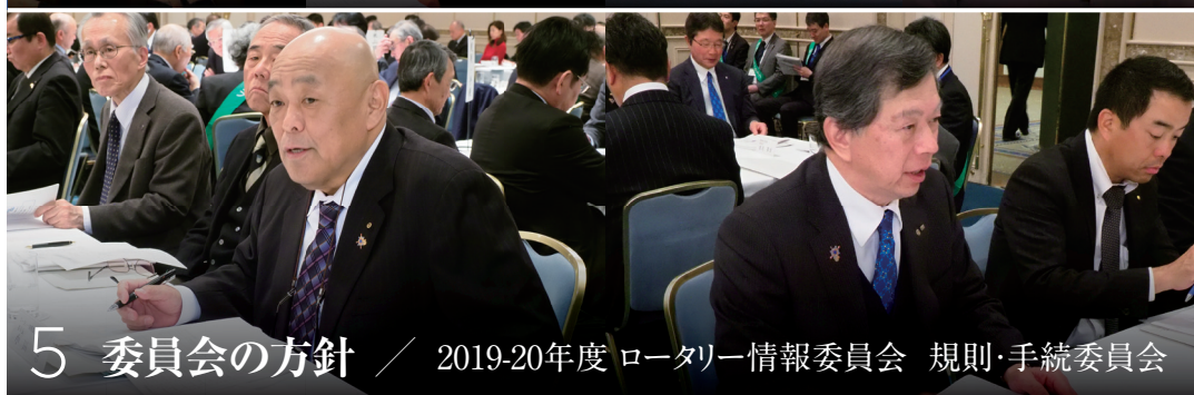
5 委員会の方針 / 2019-20年度 ロータリー情報委員会 規則・手続委員会