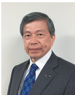
2019-20年度 規則・手続委員会委員長