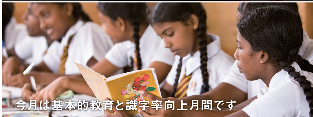
今月は基本的教育と識字率向上月間です