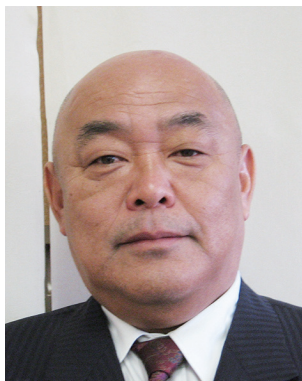
2019-20年度 ロータリー情報委員会委員長