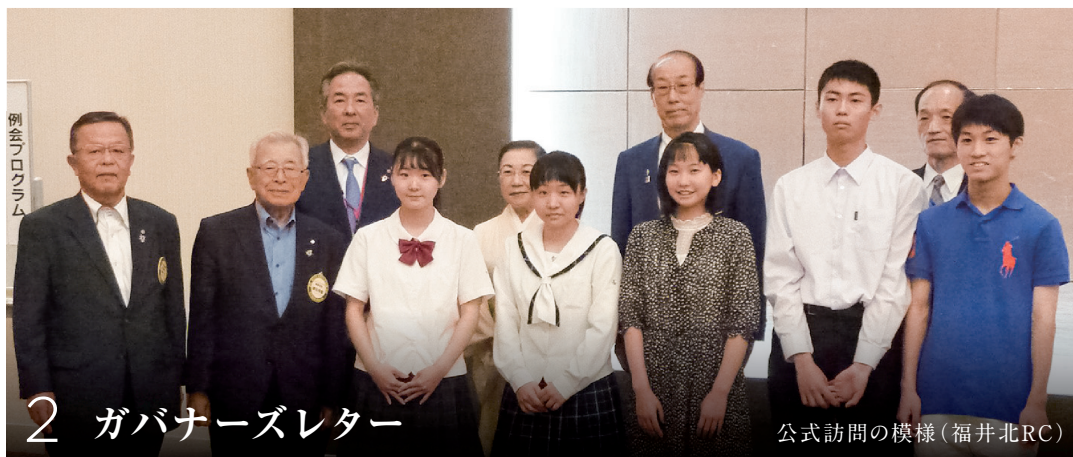
2 ガバナーズレター