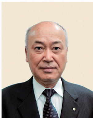
2019-20年度 ガバナー補佐 (京都南部第1)