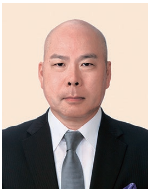
2019-20年度 ガバナー補佐 (京都市域第1)