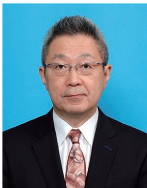
2019-20年度 RLI委員会委員長