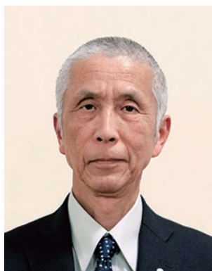
2019-20年度 ガバナー補佐 (滋賀県第3)