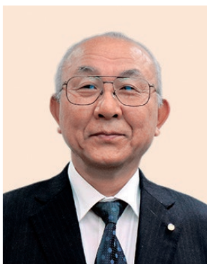
2019-20年度 ガバナー補佐 (福岡県第3)

そこで、現行の『標準ロータリークラブ定款 第6条「五大奉仕部門」第2項』では、「 奉仕の第二部門である職業奉仕は、事業および専門職務の道徳的水準を高め、品位ある業務はすべて尊重されるべきであるという認識を深め、あらゆる職業に携わる中で奉仕の理念を実践していくという目的を持つものである。会員の役割には、ロータリーの理念に従って自分自身を律し、事業を行うこと、そして自己の職業上の手腕を社会の問題やニーズに役立てるために、クラブが開発したプロジェクトに 応えることが含まれる。 」とある。職業奉仕とは、ロータリークラブと会員両方の責務であるとし、ロータリアンが奉仕の理念を実践して得た職業上のスキルを役立て、クラブが開発した様々なプロジェクトに応えることである。日本のロータリークラブにおいても、更に「職業奉仕部門」としてのプロジェクトが研究開発されることを期待する。