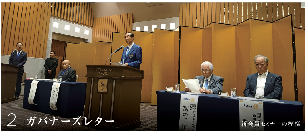
2 ガバナーズレター