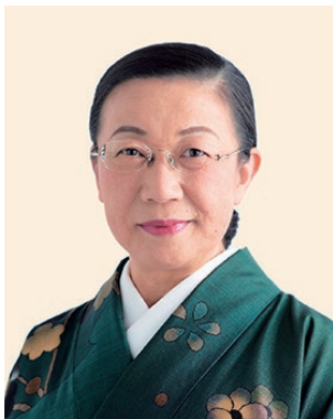
2019-20年度 ガバナー補佐 (福井県第2)