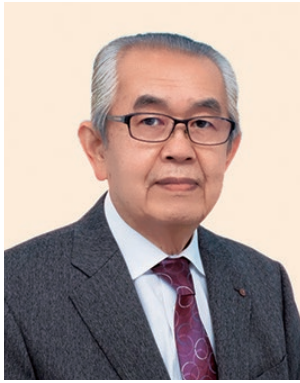
2019-20年度 ガバナー補佐 (京都市域第3)