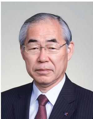
2019-20年度 ガバナー補佐 (滋賀県第2)

また「奉仕」は訳せばサービスと言うことですが、日本人では無料と感ずますが欧米人は有料と思うそうです、このようにロータリーでも「職業奉仕」のとらえ方があちらとこちらでは違うような気がします。日本のロータリーの「職業奉仕」の言葉の中に含まれる公正さや倫理観など、大げさに言えば「職業奉仕道」とも言えそうな精神性など、同様に欧米人にはイメージすることが出来ないのかもしれませんが。今日本で叫ばれている「働き方改革」の中にも同じ問題があるのではないのでしょうか。