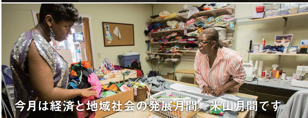
今月は経済と地域社会の発展月間 / 米山月間です