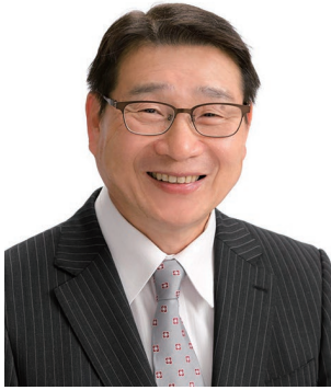
2019-20年度 ガバナー補佐 (福井県第1)