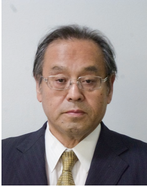
2019-20年度 ガバナー補佐 (奈良県第2)