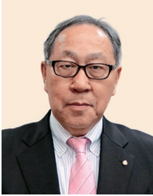
2019-20年度 ガバナー補佐 (滋賀県第2)