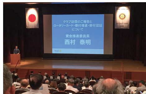
2019-20年度 財団資金推進委員会 委員長

ロータリー財団の原点である「世界でよいことをしよう」にさらなるご理解を深めて頂き、クラブ内での寄付増進をはかって頂ければ幸いです。