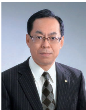
2019-20年度 地区ロータリー財団委員会 委員長