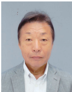
2019-20年度 大口寄付・ポリオプラス委員会 委員長