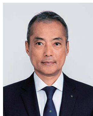
2019-20年度 財団奨学金・平和フェロシップ委員会 委員長

なかなか決まらないという事が多々ございます。財団奨学生・平和フェロシップの奨学生を輩出することにより、優れた研究者と出会い、その支援という持続可能な社会貢献が可能となります。ロータリアンの皆様からの貴重な浄財を活かすために、また日本の、そして人類の将来の為に、ぜひチャレンジして頂きますよう、ご協力のほどを、どうぞよろしくお願いいたします。