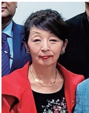
2019-20年度 グローバル補助金委員会 委員長