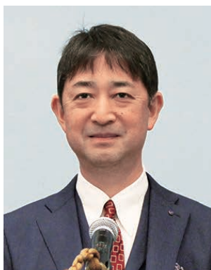
2019-20年度 地区補助金委員会 委員長

「利害の対立」条項や、事業の開始時期、継続事業への補助については、今後とも議論を重ねながら理解や認識が深まるように心がけます。使い良い地区補助金に成長すること、ロータリー財団への寄付が増えることは、相乗効果の同時進行と考えます。今後ともご理解とご協力よろしくお願いいたします。