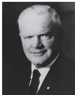
国際ロータリー 1969-70年度会長 ジェームス F.コンウェイ