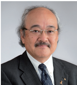
2017-18年度 京都北部ガバナー補佐