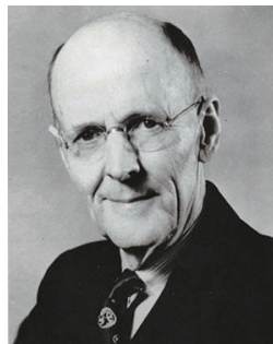
国際ロータリー 初代会長 ポール・ハリス

「人間というのは人間、信条、政治理念に関係なく、 同胞に親しみを覚えるものです。 多様であればあるほど、活気溢れ喜ばしいものとなります。」