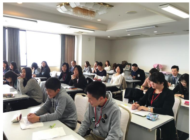
一夜明けると表情も変わっています。