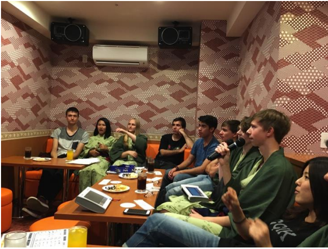
カラオケで盛り上がっています！