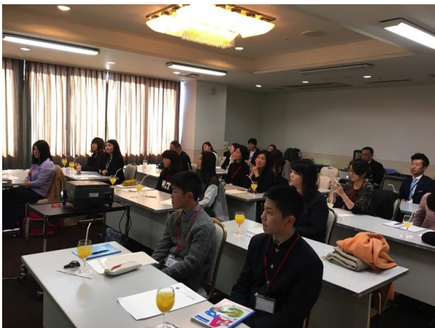
真剣な面持ちの初日の研修風景