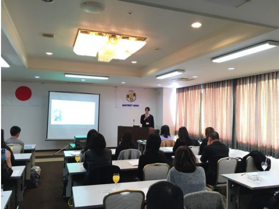
派遣予定学生のスピーチ

第4回・5回研修会 3月12日(土)—13日(日) 長浜ロイヤルホテルに於いて1泊2日の研修会を開催いたしました。(4回・5回派遣予定学生研修会)初日は日本語と英語によるプレゼンテーションをして頂き、その夜、帰国学生や青少年学友会の学生達より、派遣国の様々なことを聞きそして「このロータリーの青少年交換プログラムを通して、将来どんなことをしたいのか?」についての作文を考え、殆ど寝ていない状態でしたが、翌朝元気な笑顔で、宿題のスピーチをしてくれました。学生達がどのような夢を持っているのかがよくわかり、私達地区委員も感動をした研修会でした。出発までまだまだ勉強を重ねてください。