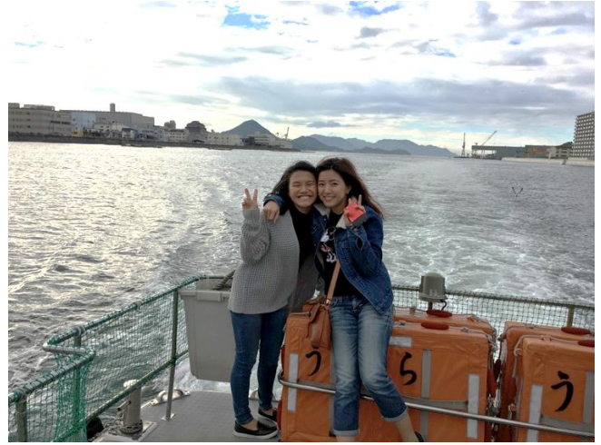
宮島からボートで広島平和公園へ