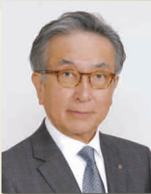
国際ロータリー第 2650 地区 2015-16 年度ガバナー