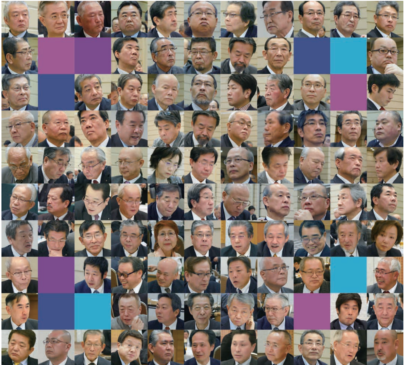
会長エレクト研修セミナーにて