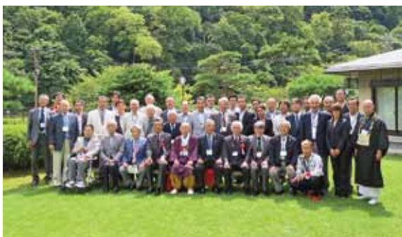
8月20日 京都西北ロータリークラブ