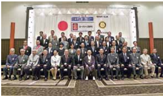
8月8日 榎原ロータリークラブ