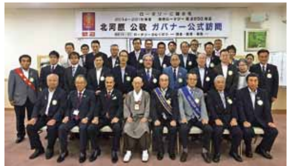
8月25日 福井東ロータリークラブ