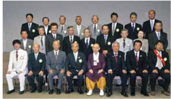
8月21日 京丹後ロータリークラブ