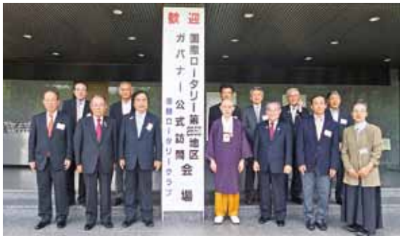
8月7日 彦根ロータリークラブ