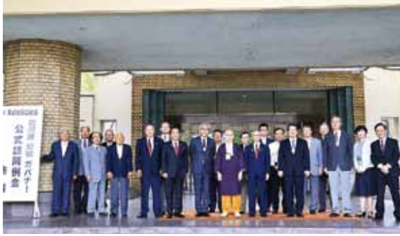
8月6日 大津東ロータリークラブ