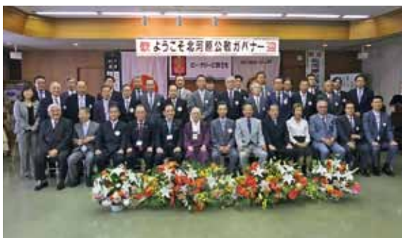
8月19日 大和高田ロータリークラブ