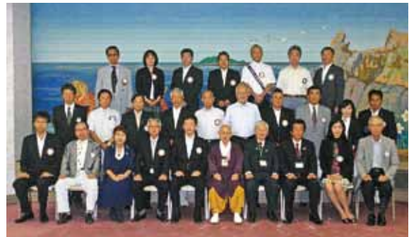
8月22日 三国ロータリークラブ