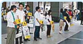
第2720地区(熊本・大分) みんなで知ろう盲導犬 熊本グリーンロータリークラブ