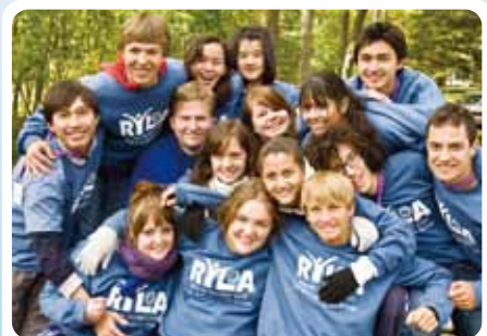
ロータリー青少年指導者養成プログラム (RYLA)