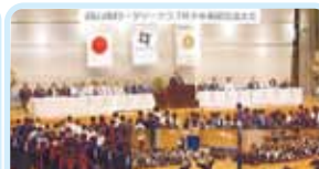
第2530地区(福島) 少年剣道交流大会 郡山南ロータリークラブ