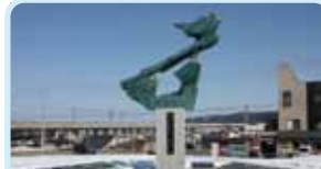
第2560地区(新潟) 現代雪祭り発祥の地モニュメントの除幕式 十日町北ロータリークラブ