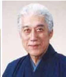
千玄室 Genshitsu Sen 茶道裏千家前家元15代汎叟宗室 京都RC