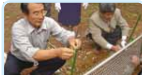
第2580地区(東京・沖縄) 例会2,000回記念事業で植樹 宜野湾ロータリークラブ