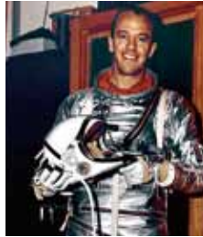
アラン・シェパード Alan Bartlett Shepard Jr. アメリカ合衆国最初の宇宙飛行士 マーキュリー・セブンの一人