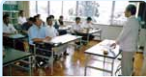
第2620地区(静岡・山梨) 職員研修に講師派遣 焼津ロータリークラブ