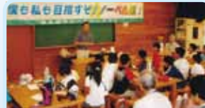
第2650地区(福井・滋賀・京都・奈良) 僕も私も目指そうノーベル賞 武生府中ロータリークラブ