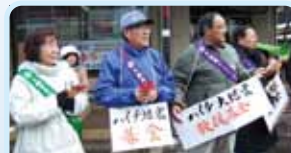
第2540地区(秋田) ハイチ大地震救援募金 大館南ロータリークラブ