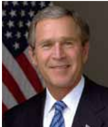
ジョージ・W・ブッシュ George W. Bush 第43代アメリカ合衆国大統領 Washington DC RC

photo : Official Portrait of President Ronald Reagan