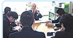
第2520地区(岩手・宮城) 人生の先輩として 古川東ロータリークラブ