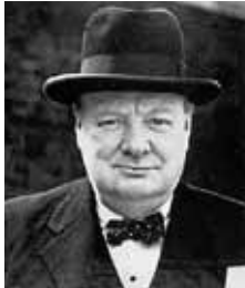
ウィンストン・チャーチル Winston Churchill チャーチル元英国首相 London RC