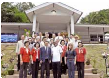
図書館・トイレ・学校建設事業

(日本のロータリークラブは各地域での活動の他に34の地区に分かれて地区単位の活動も行っています)