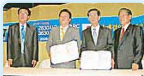
第2830地区(青森) 訪韓で交流 八戸南ロータリークラブ

国際理解、親善、平和を推進するために、実施する数多くのプログラムや活動。異なる国や文化の人々に対する認識を培っています。