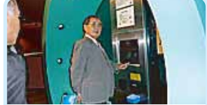
第2700地区(福岡・佐賀・長崎の一部) 人気の職場例会 鳥栖ロータリークラブ