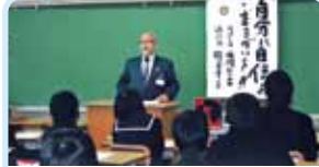
第2670地区(愛媛・香川・徳島・高知) 出前職業講座 普通寺ロータリークラブ