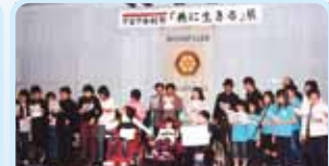
第2680地区(兵庫) あーと参加型市民祭「共に生きる」展を開催 宝塚ロータリークラブ