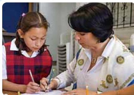
識字率向上プロジェクト