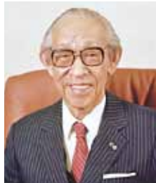
松下幸之助 Kounosuke Matsushita パナソニック株式会社創業者 大阪RC