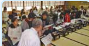
第2630地区(岐阜・三重) 和の心とマナー教室 津南ロータリークラブ