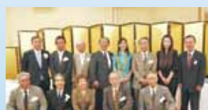
留学生の支援(米山記念奨学会)