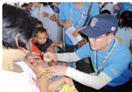
ポリオワクチン投与(フィリピン・レイテ島)