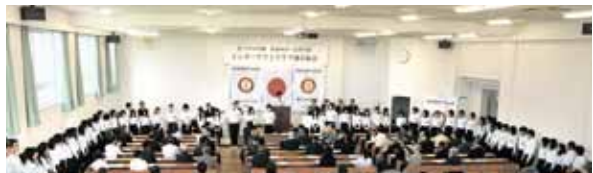
インターアクトクラブ (高校生・12～18歳が入会資格を持つ世界的な友好クラブ)

指導力養成活動、社会奉仕プロジェクトおよび国際奉仕プロジェクトへの参加、世界平和と異文化の理解を深め育む交換プログラムを通じて、青少年ならびに若者によって、好ましい変化がもたらせることを認識するものです。