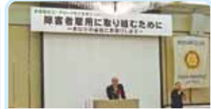
第2650地区(福井・滋賀・京都・奈良) 職業雇用シンポジウム 京都西北ロータリークラブ