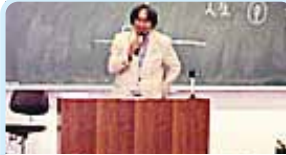
第2620地区(静岡・山梨) 人生の先輩として、大学で講演 甲府シティロータリークラブ

各会員の職業を生かし、青少年に対し職業指導・就職相談を行ったりしています。日本では、職業倫理についての関心が高く、「職業奉仕こそがロータリーのロータリーたるゆえんである」と言われています。