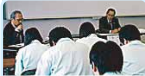
第2600地区(長野) 地域の担い手を育てる 岡谷エコロータリークラブ