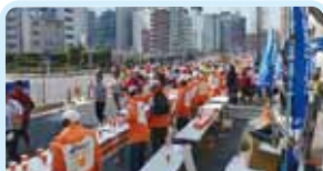
第2750地区(東京・北マリアナ諸島・グアム・ミクロネシア・パラオ) 銀座・日本橋グループの9クラブによる 東京マラソンでの支援活動