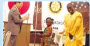
第2640地区(大阪南部・和歌山) カーナの子どもを援助 大阪金剛ロータリークラブ