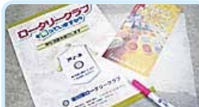
第2790地区(千葉) ロータリーを知ってもらおう 市川東ロータリークラブ