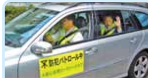
第2660地区(大阪北部) 防犯パトロール隊結成 大阪心斎橋ロータリークラブ