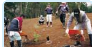
第2650地区(福井・滋賀・京都・奈良) 植樹活動 勝山ロータリークラブ