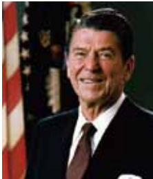
ロナルド・レーガン Ronald W. Reagan 第40代アメリカ合衆国大統領 Pacific Palisades RC

photo : John F. Kennedy, photograph in the Oval Office.