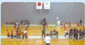
第2710地区(広島・山口) 小学生バレーボール大会 小野田ロータリークラブ