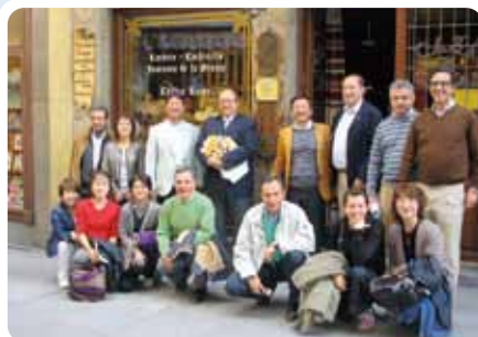
友情交換プログラム