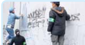
第2650地区(福井・滋賀・京都・奈良) 京都市内 24 クラブ合同による 落書き除去・清掃活動