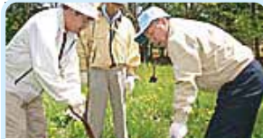
第2500地区(北海道東部) 地域の公園に植樹 帯広東・帯広北・音更ロータリークラブ