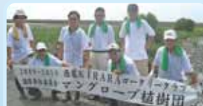
第2760地区(愛知) タイでマングローブ植樹 西尾KIRARAロータリークラブ