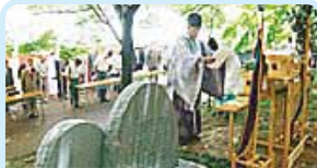
第2550地区(栃木) もみじ谷に植樹 足利ロータリークラブ