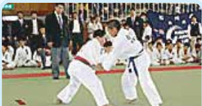
第2610地区(富山・石川) 少年柔道練成大会 金沢北ロータリークラブ