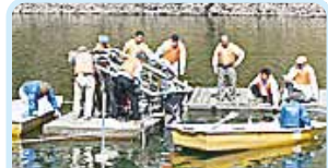
第2840地区(群馬) 炭素繊維で水質改善を 富岡中央ロータリークラブ