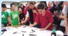
第2780地区(神奈川) オーストラリアで小学生同士が交流 伊勢原平成ロータリークラブ