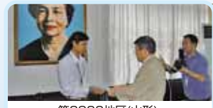
第2800地区(山形) カンボジア「パンヤサステラ大学」 学生への奨学金支給 米沢ロータリークラブ