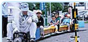
第2510地区(北海道西部) 5年連続「子ども天国」と WCS支援チャリティーバザー開催 室蘭ロータリークラブ