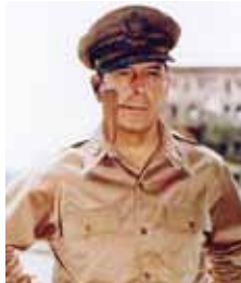
ダグラス・マッカーサー Douglas MacArthur アメリカ軍元帥・連合国軍最高司令官 東京RC

This is photograph No. HJ 90973 from the Imperial War Museum Collectors