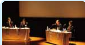
第2570地区(埼玉西北) 友好都市3市のサミットを開催 行田ロータリークラブ