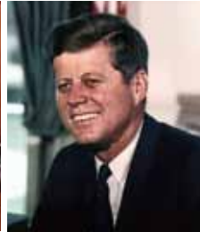
ジョン・F・ケネディ John F. Kennedy 第35代アメリカ合衆国大統領 Hyannis RC

photo : John F. Kennedy, photograph in the Oval Office.