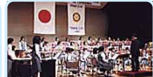
第2770地区(埼玉南東) 中学生音楽フェスティバル 八潮シティロータリークラブ