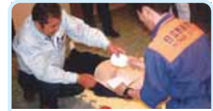
第2820地区(茨城) AED講習会 日立港ロータリークラブ