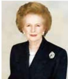
マーガレット・サッチャー Margaret Hilda Thatcher, Baroness Thatcher 第71代英国首相

Official photograph portrait of former U.S. President George W. Bush.