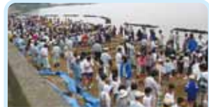
第2690地区(岡山・鳥取・島根) 100年かかって、宍道湖をきれいに 松江南ロータリークラブ