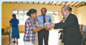
第2590地区(横浜市・川崎市) スリランカの児童養護施設を訪問(国際奉仕) 川崎鶴沼ロータリークラブ