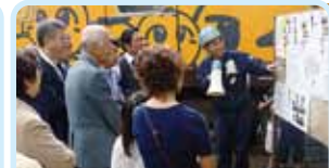
第2730地区(鹿児島・宮崎) 肥薩おれんじ鉄道へ職場訪問 鹿児島西ロータリークラブ