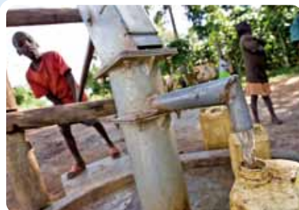
水資源の確保・設備支援