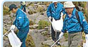
第2740地区(長崎・佐賀) 山頂例会で清掃 雲仙ロータリークラブ