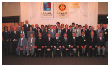
10月24日 宇治鳳凰ロータリークラブ