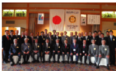
10月10日 京都洛東ロータリークラブ