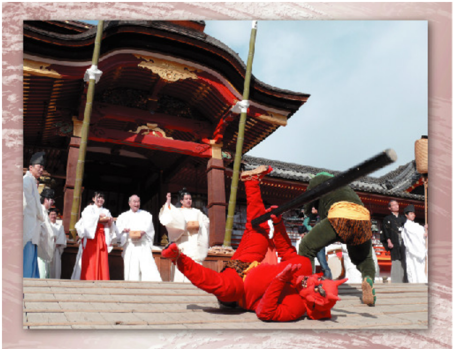
鬼やらい神事

— from Your Good to Our Good — 「あなたの善からみんなの善へ」