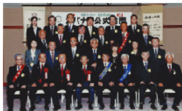
10月15日 勝山ロータリークラブ