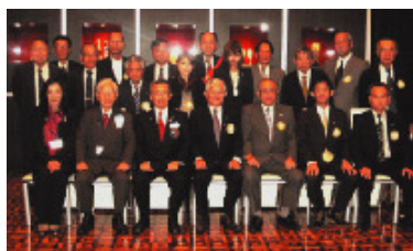
10月18日 福井西ロータリークラブ