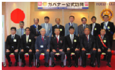
10月16日 鯖江北ロータリークラブ