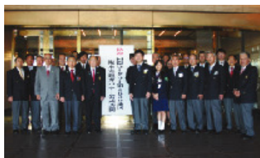
10月17日 奈良西ロータリークラブ