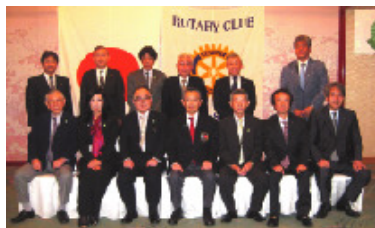
10月23日 京都嵯峨野ロータリークラブ