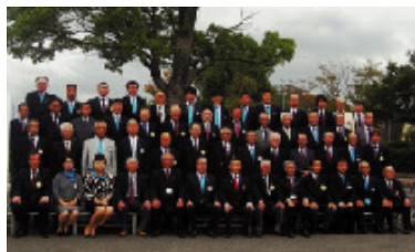
10月22日 水口、湖南ロータリークラブ