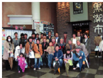
—和歌山へ海、自然の研修旅行—

これは、一例ですが、各クラブで身近にできる「世界理解」の推進と、国際交流の拡大に努めていただければ幸いです。