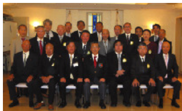
10月17日 京都田辺ロータリークラブ