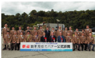
10月9日 大野ロータリークラブ