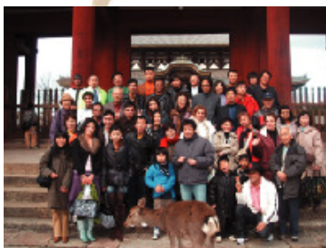
—奈良へ日本文化、歴史の視察—