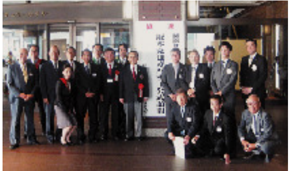
9月17日 京都西南ロータリークラブ