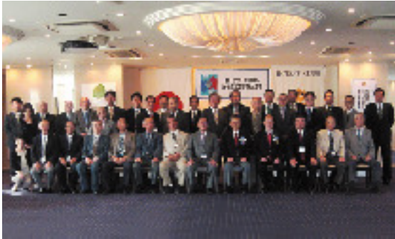
9月9日 大和郡山ロータリークラブ