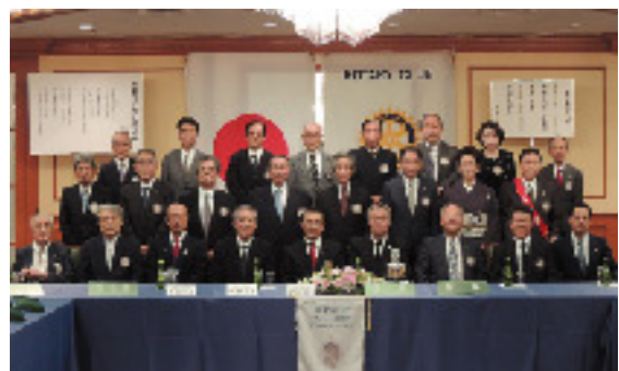
9月20日 京都紫竹ロータリークラブ