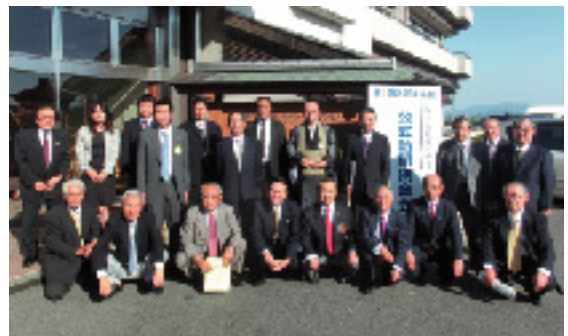
9月19日 大津西ロータリークラブ