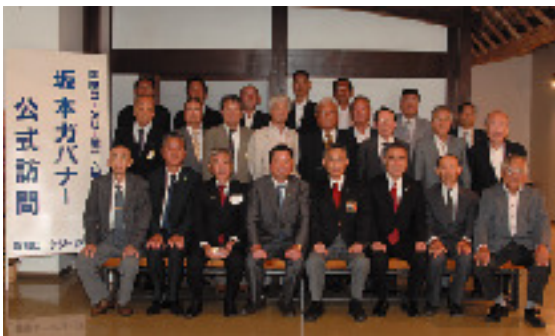
9月11日 園部ロータリークラブ