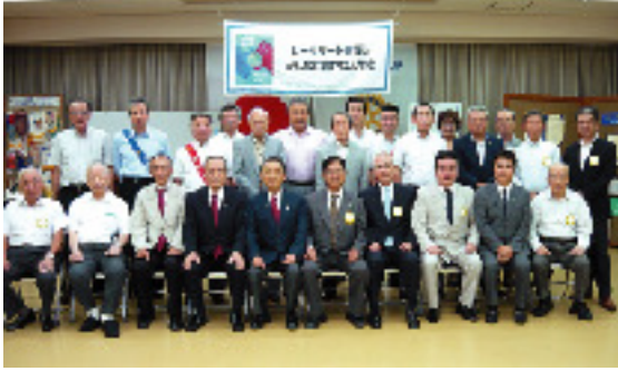
9月6日 京都城陽ロータリークラブ