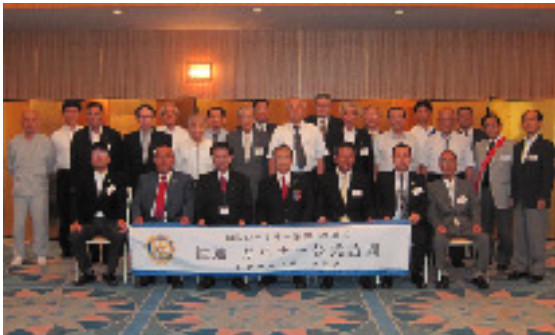
9月10日 若狭ロータリークラブ