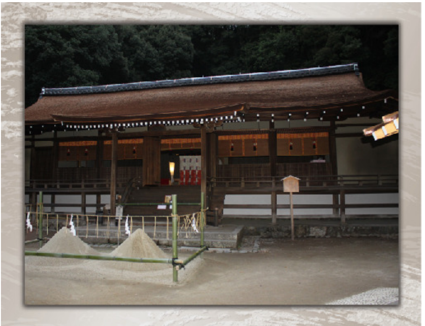
宇治上神社拝殿

— from Your Good to Our Good — 「あなたの善からみんなの善へ」