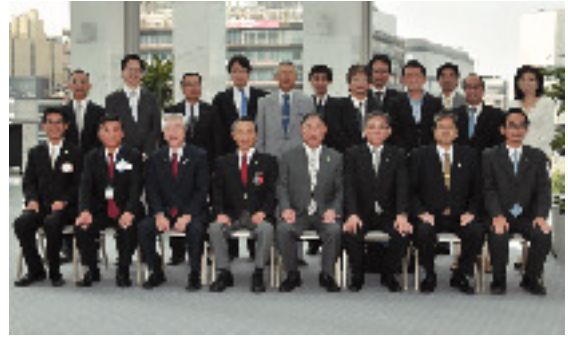
9月13日 京都伏見ロータリークラブ