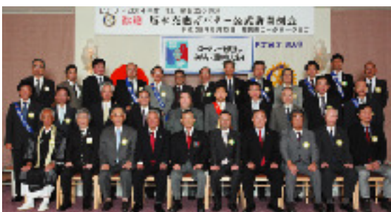
9月12日 舞鶴東ロータリークラブ