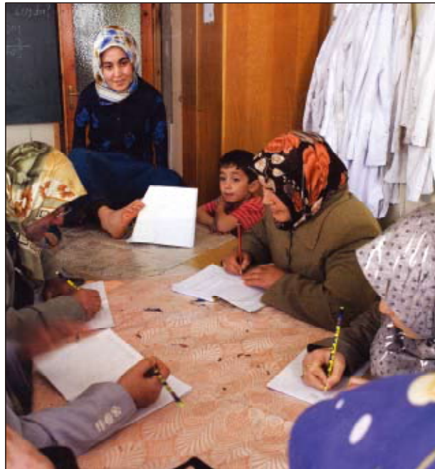
トルコのロータリアンが識字の扉を開く 「ROTARY WORLD」2006年10月号より転載