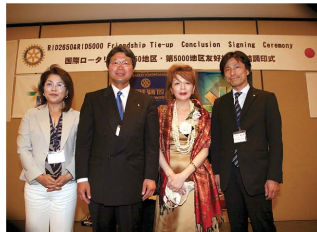
ロータリー友情交換(国際交流)委員会 今年度・次年度のスタッフ

また同会において既に提携している5組のクラブ(ホノルルRCと京都RC、ワヒアワワイアルRCと京都洛中RC、ホノルル西RCと京都西RC、カウアイRCと守山RC、カボレイRCと福井RC)が紹介された後、提携を希望あるいは検討しているキエイワイレアRC、ポイブビーチRC、京都洛西RC、奈良大宮RC、園部RCが紹介され、出席されているクラブの方が自分のクラブの自己紹介をされました。近い将来、この中で姉妹クラブが誕生することを期待しております。