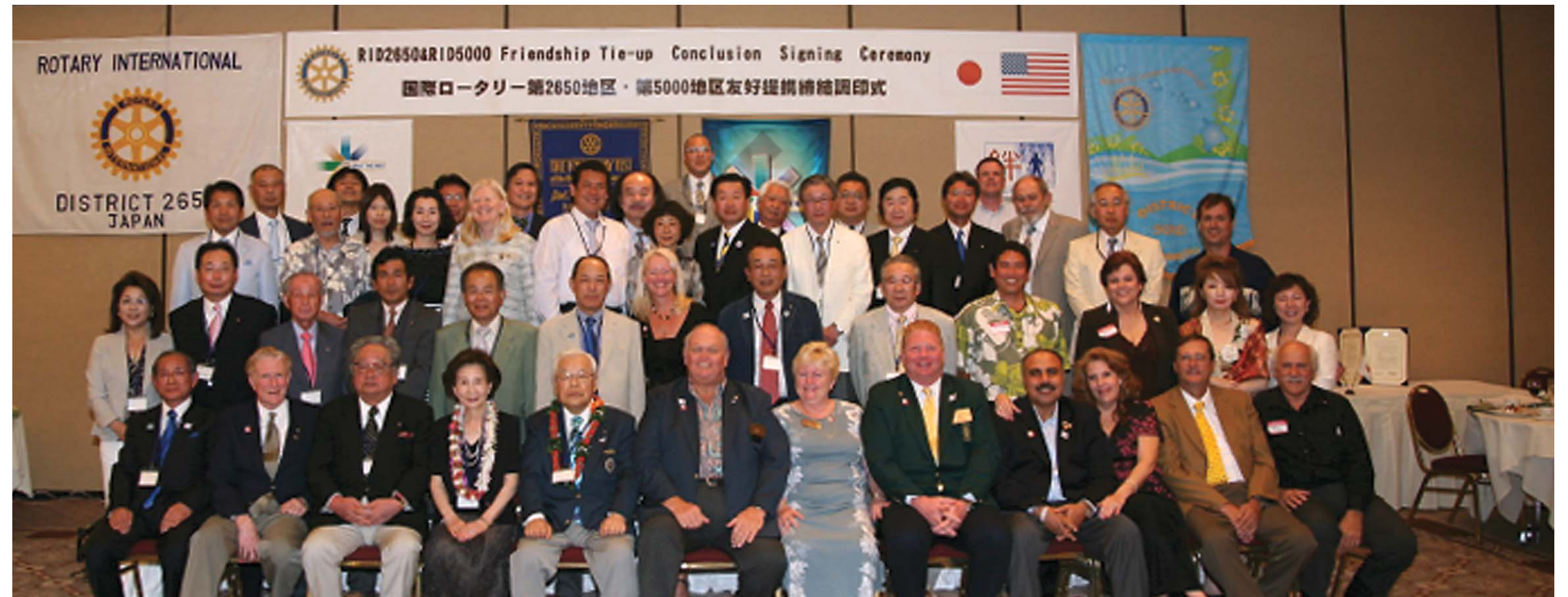
地区友好提携締結調印式の後、記念撮影