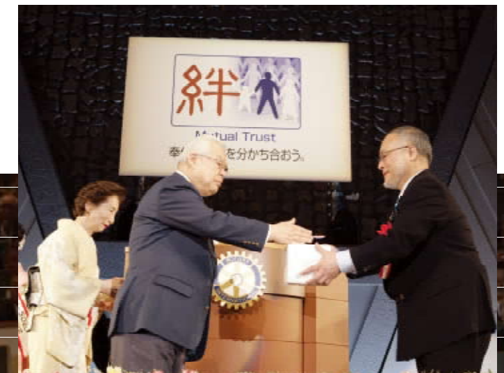
関場RI会長代理ご夫妻へ記念品贈呈