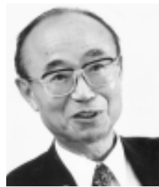
青少年シンポジウム講師 国際日本文化研究センター所長 山折 哲雄