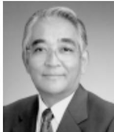
ガバナー 西村 二郎